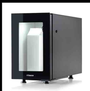
Mini frigo FR7L